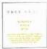
Bougie Mimosa au Pollen, True Grace , 33,20 €.