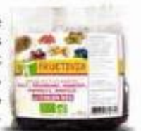
Mélange de 5 Fruits Séchés et Pollen Bio, Fructivia , 12,90 €.