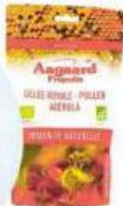
Gelée Royale, Pollen et Acérola, Aggaard Propolis , 22,30 €.

L'idéal est de consommer le pollen avec des fruits frais : l'assimilation de ses nutriments n'en est que meilleure ! Saine et savoureuse, cette collation riche en vitamine C est idéale.