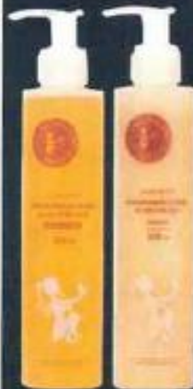
Shampooing Soyeux au Miel d'Acacia ou au Miel d'Oranger, Secrets de miel , 12,50 € le flacon.