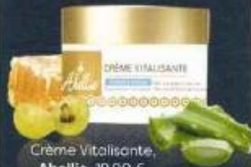
Crème Vitalisante, Abellie , 19,90 €.