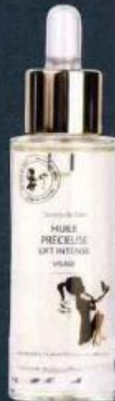
Huile Précieuse Lift Intense Visage, Secrets de miel , 40 €.