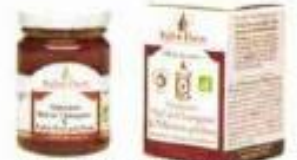
Préparation Dynamisée au Pollen Polyfloral Bio, Ballot Flurin , 10,30 €.