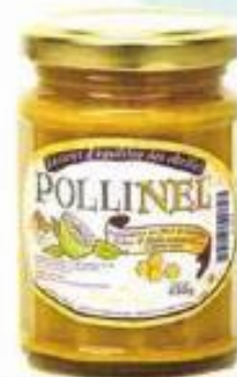
Préparation au Miel de Garrigue, Pollen et Huile Essentielle de Citron Vert, Pollinél , 9,90 €.

Utilisé depuis des siècles en médecine traditionnelle chinoise puis oublié, le pollen revient sur le devant de la scène ! Pour tout connaître de sa culture, de sa récolte et des propriétés thérapeutiques des autres produits de la ruche, l'Union nationale de l'apiculture (Unaf), a créé un site de référence complet et accessible à tous. unaf-apiculture.info/