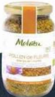
Baume Réconfortant Nectar de Miels, Lait Fondant Réconfortant Nectar de Miels, Pollen de Fleurs Énergie & Vitalité, Melvita , de 15 à 18,50 €.